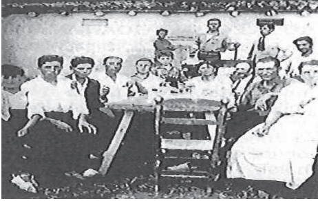
Components de la família Colom.