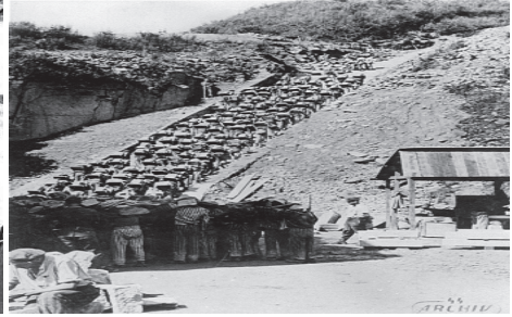
Camp de concentració de Mauthausen.