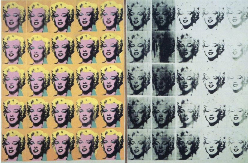
Marilyn Diptych de Andy Warhol. Tate Gallery < http://www.tate.org.uk/servlet/ViewWork?workid=15976&stabview=image >.

cidien cronològicament; i aquell en què ho feien el moviment artístic i el moment de producció del musical.