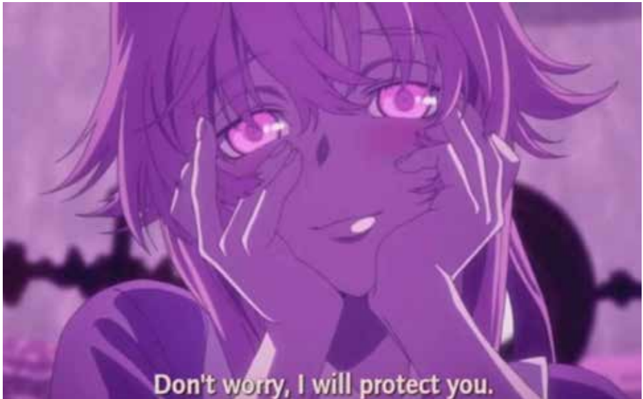
Figure 1 Exemple de Yandere, Gasai Yuno de Mirai Nikki