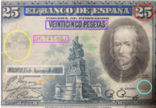
Part pràctica, anàlisi dels bitllets de pesseta.

el procés de fabricació tant dels bitllets com de les monedes i les seves parts. He extret la informació de diverses pàgines digitals i llibres. Seguidament he explicat una breu història de la banca de Palamós, la meua població, a partir dels llibres de l'Arxiu Municipal. L'última part ha estat una entrevista a un banquer que m'ha explicat de primera mà els fets més rellevants durant la seva carrera laboral. Aquesta entrevista ha sigut una explicació del món bancari des del 1977 fins al 2020 i m'ha servit d'ajuda per entendre millor la història dels diners.